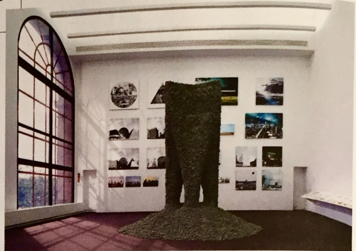
Gramazio Kohler Research (ETH Zurich) + Sef-Assembly Lab (MIT), Rock Print (2015).

Cento autori sono radunati all'interno di una mostra tumultuosa e spesso entusiasmante One hundred authors gather at the exciting, indeed tumultuous exhibition